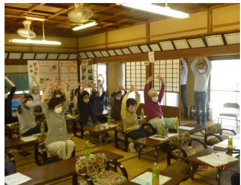
レクリエーションの様子