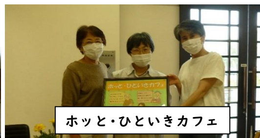
ホッと・ひといきカフェ