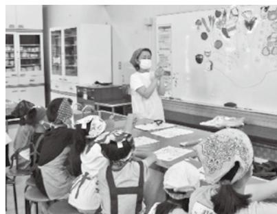
▲栄養士さんより食べ物の話を聞きました

現在市内では3か所のこども食堂が開設されており、新たに日置地区でも開設される予定です。子どもが自分の足で行くことのできるこども食堂が、小学校区ごとにできていくことを目指し、社協ではこども食堂の立ち上げ、運営の相談をお受けしています。補助金制度もありますので、こども食堂に興味のある方、ぜひお問い合わせ下さい。