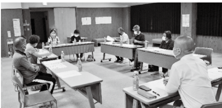
▲地域で開催される事業への理解も深まりました。

進めていくためには、①福祉委員として活動が可能な場合は事業に協力する ②事業案内チラシを必要方へ配布し周知する。 ③地域内で事業に参加いただく協力者を発掘する」など意見がだされました。各事業ともコロナの影響で、開催が中止や休止されたこともあり、利用者や協力者が減少傾向にあります。福祉委員活動として今後も支援を継続します。