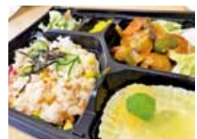
混ぜ寿司と肉団子の甘酢あんのお弁当