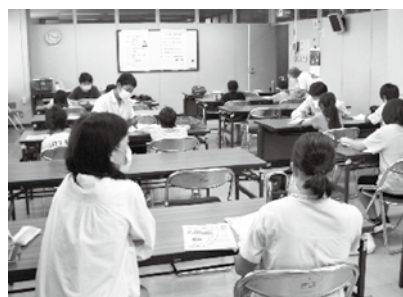
▲集中して勉強しています