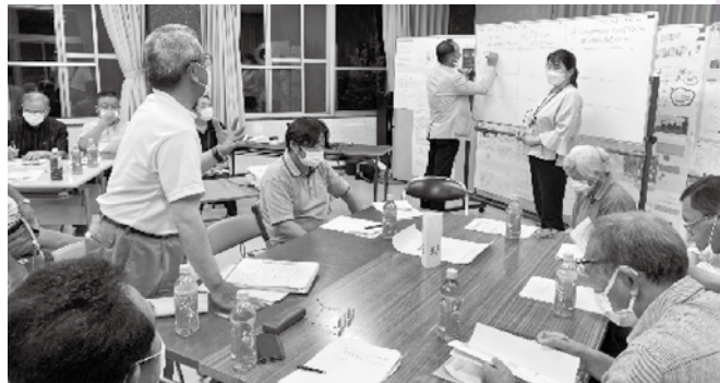
▲グループごとに発表している様子

『支え合いの地域づくり』と言われても、実際どうしたらいいの？という疑問をなくすため、はじめに、どのような地域活動や取り組みがあるのか、また、市内にはどのような高齢者等の福祉サービスがあるのか説明を行い、続いて、地域の高齢者等にとの関わりや取り組みができるのか、意見交換を行いま