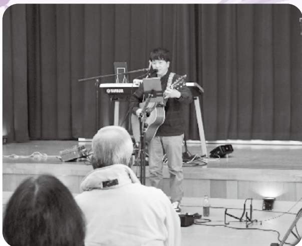
ちめいどさんによる演奏

丹波篠山市ボランティア連絡協議会は、随時ボランティアグループ、個人ボランティアの加入を募集しています。今回のようなボランティアのつどいを開催したり、活動費の助成を行い、支援を行っていますので、参加希望の方はお気軽にご連絡ください。