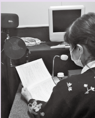
▲図書館録音室にて

少ないですが、楽しく活動しています。ささやかな活動ですが、息長く続けていこうと考えています。ぜひ私たちと一緒に活動しましょう。待っています。