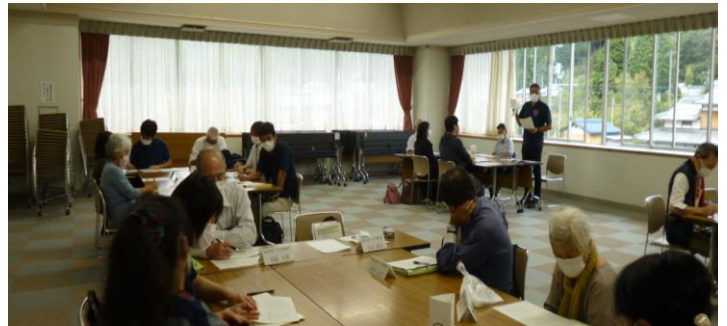
令和3年10月13日西紀支部民生委員・児童委員と介護支援専門員・相談支援専門員との交流会の様子

今回過去の交流会のなかで民生委員さんからいただいたご意見を参考に「民生委員・児童委員とケアマネジャー・相談支援専門員との連携ガイド・あいさつ票」を作成しました。今後は連携ガイドを活用して、あいさつから連携の一步を進めていきます。