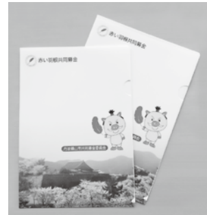
▲オリジナルクリアファイル

業所をはじめ、寺院の皆さんには法人募金として、幼稚園児・小学生・中学生・高校生の皆さんには学校募金として、市役所や社会福祉施設の職員の皆さんには、職域募金としてご協力いただいています。