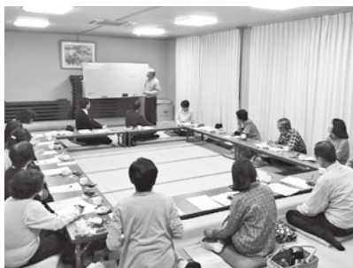
▲平成30年4月14日 住吉台地区福祉会議にて地域状況の共有

平成30年4月14日、住吉台自治会役員、民生委員児童委員、民生児童協力委員、福祉委員、住吉台コミュニティサポーター代表、社会福祉協議会職員が集まり、地域の福祉課題を話し合う、「住吉台地区福祉会議」が開催されました。