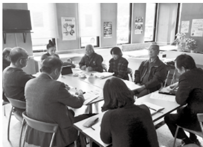
▲平成30年12月12日 地域ねとわーく会議（コープこうべ出席）に住吉台シニアクラブ役員が参加

その後、買物支援を住吉台独自で進めていくため、社協にアドバイスを求めつつ、淡路市の移動販売の取り組みを現地まで見学、また市内の小売業者と出張、出前販売を協議するなど、さまざまな買物支援の形を模索しました。