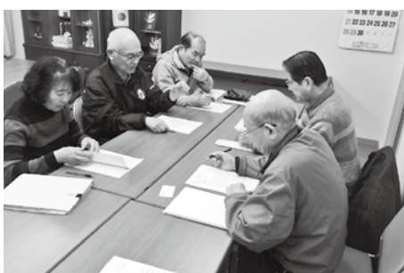
▲平成31年4月10日 住吉台自治会役員、住吉台シニアクラブ役員との協議

平成31年4月10日、住吉台自治会（以下、自治会）役員、シニアクラブ役員が協議し、自治会内で現在困っている人がいること、また数年後には、更に困る人が増えることを考え、自治会として取り組みを進めていくことで合意形成が図られました。