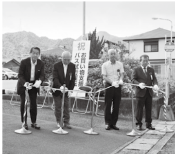
▲令和2年10月1日 住吉台バス発車式 セレモニー

自治会、シニアクラブ、市担当部局、神姫バス、公共交通協議の各部署で協議を継続した結果、令和2年10月1日から、半年間の試行期間として、新しいバスルート及びダイヤで、運行がスタートしました。バス試行発車式当日は、神姫グリーンバス(株)代表取締役、並びに、丹波篠山市長を招いてセレモニーを行い、大勢の住民が、市内のスーパーで買物をするために乗車しました。