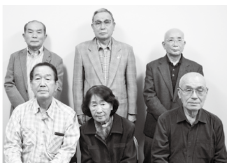
▲住吉台自治会役員・住吉台 シニアクラブ役員