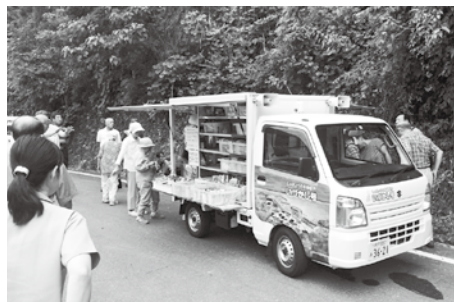
▲平成30年8月10日 淡路市視察研修に住吉台シニアクラブ役員が参加

住吉台シニアクラブ（以下、シニアクラブ）が、独自でアンケート調査を実施し、住吉台の高齢者の買い物や移動に関する想いを聞き取りました。その結果、すでに買い物手段がなく、自分で買い物に行けていない人が相当数いることがわかり、本格的に考えていくことが必要と、シニアクラブ内で共有されました。