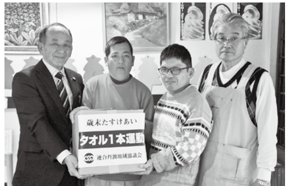
▲お寄せいただいた物品を各事業所に配分します