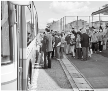
▲令和2年10月1日 住吉台バス発車式 乗車の様子

一人でバスに乗ることが不安な高齢者には、シニアクラブ会員が付き添い、ニコパカードの使い方を教えるなど、安心してバスに乗れるようサポートしていました。