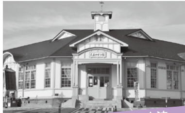
丹波篠山の町を良くする方法

11月1日～翌年1月31日までの間に、4487(ししはな)サプレ8枚箱入(1,000円)、5枚袋入(500円)を購入する。