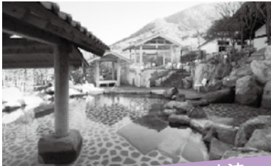
丹波篠山の町を良くする方法

11月1日～翌年3月31日までの間に、源泉掛け流しの温泉に入浴する。(大人700円)