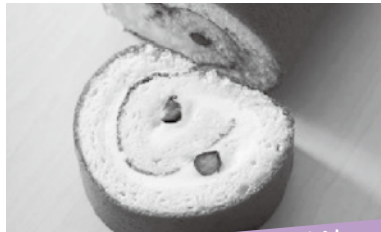
丹波篠山の町を良くする方法

10月1日～11月30日までの間、デザートに川北ロール(1,150円)を食べる。お土産にも!