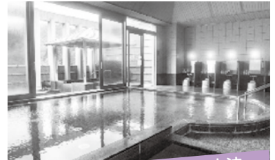
丹波篠山の町を良くする方法

1月1日～3月31日までの間に、光明石温泉に入浴する。(大人400円、小人300円) ※別途、入場料要