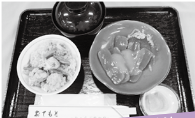
丹波篠山の町を良くする方法

10月1日～12月31日までの間、お昼ご飯にとふめし定食(800円)を食べる。※とふめし定食の提供日は、毎週水・日曜日及び祝日となります。