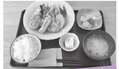
丹波篠山の町を良くする方法