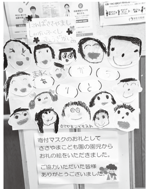
園児からのお礼の手紙