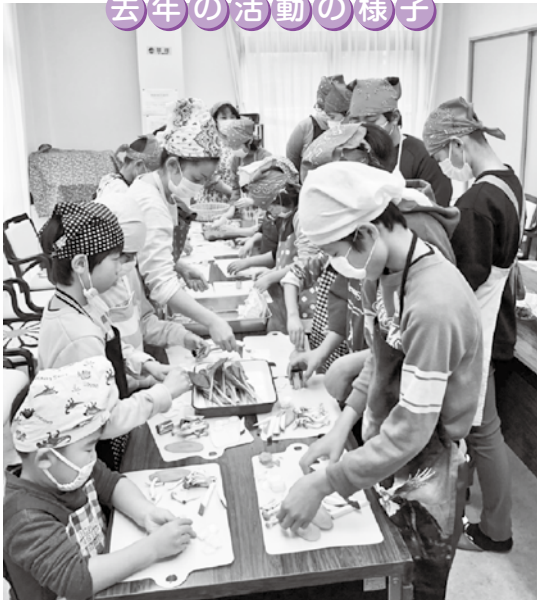
北っこり食堂（西紀北）