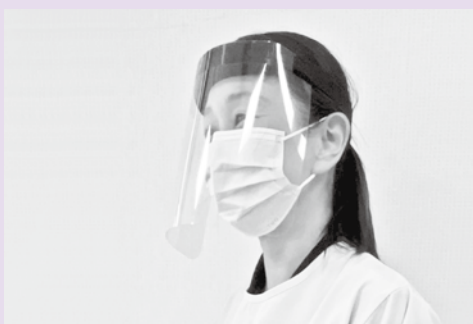
フェイスシールド着用例

今回のマスク不足では、市からの介護職に対する給付や、洗濯をしての再利用で、乗り切ることができました。