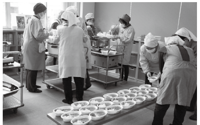
おかのっ子広場（岡野）